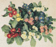
307 Gartenprimeln ( Primula veris )