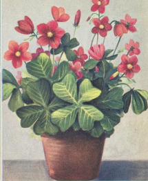
742 Vierblättriger Glücksklee

Für den Glücksklee gibt es viele Verwendungsmöglichkeiten. Wir können die kleinen Knöllchen in Töpfe setzen, zur Einfassung verwenden oder auch in den Steingarten pflanzen; überall wirkt der Glücksklee vorteilhaft. In einen kleinen Topf von ca. 6 cm Durchmesser setzen wir 5 Knöllchen und haben nur noch für Wasser zu sorgen. Bald treiben die Knöllchen aus und gefallen alt und jung. Für Einfassungen setzen wir alle 5 cm ein Knöllchen etwa 5 cm tief in die Erde. 10 Stück –,60 DM 25 Stück 1,30 DM