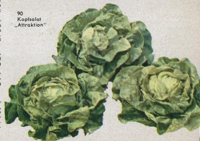
90 Kopfsalat „Attraktion“

98 Pfücksalat, amerik., brauner, sehr zart. 1 Port. -20 DM; 10 g -80 DM; 50 g 2,40 DM.