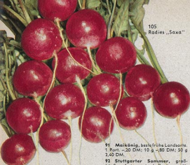
105 Radies „Saxa“