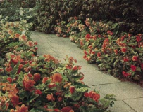
720 Riesenblumige, gefüllte Knollenbegonie