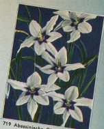
719 Abessinische Gladiole ( Acidanthera )

Stück -70 DM 10 Stück 1,40 DM 25 Stück 3,25 DM