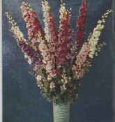
211 Hyazinthen – Ritterspor

Im nachstehenden Sommerblumen-Sortiment biete ich mit voller Absicht nur solche Blumen an, die der Gartenfreund selbst mit Leichtigkeit heranziehen kann. Zur Anzucht sind also nicht etwa ganz besondere Kniffe und Tricks notwendig, um Erfolg zu haben. Auf solche Blumen, die nur Gewächshausluft vertragen können, verzichten wir großzügig. Was wir brauchen, sind Blumen, die sich in unserer frischen Gartenluft wohlfühlen, die freudig heranwachsen und das urgesunde Blut unserer alten widerstandsfähigen Bauernblumen in sich tragen. Nur solche Blumen vermögen uns mit ihrer frohen Buntheit einen ganzen Sommer lang zu erfreuen. — Die einfache Kulturanleitung ist auf jedem Beutel nachmaß aufgedruckt, so daß praktisch Fehler so gut wie ausgeschlossen sind. Wer größere Mengen benötigt, bestelle mehrere Portionen oder fordere mein Sonderangebot brieflich an. 1 bis 2 Portionen dürften für den normalen Bedarf ausreichen. Die Wuchshöhe habe ich in ( ) angegeben. ○ = Sonne, ◐ = Halbschatten, ● = Schatten.