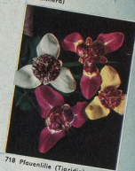
718 Pfauenlilie ( Tigridia )

5 Stück 1,10 DM 10 Stück 2,20 DM 25 Stück 5,25 DM