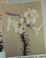
735 Königsilie (L. regale)