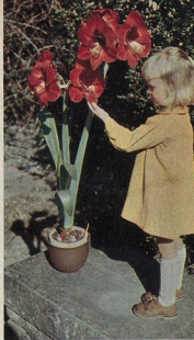
745 Ritterstern (Amaryllis)

Stück 6,— DM (rot, rosa, lachs, orange, weiß und gestreift lieferbar).