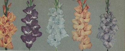
7006 Acca Laurentia 7007 Lustige Witwe 7008 Schneewittchen 7009 Bloemfontein 7010 Lavendel