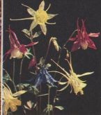
304 Akelei, Eifenschuh