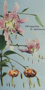
739 Japanlilie (L. speciosum)

735 Die Königsilie, Lilium regale (1 m), auffallende, fremdartig duftende Prachtlilie, deren weiße Blütenkelche an der Außenseite zartrosa überhaucht sind. Blütezeit: ab Juli 1 Stück -70 DM