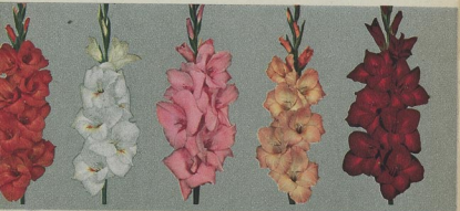
7011 Neu Europa 7012 Glory 7013 Löwenhorst 7014 Pigardy 7015 Montgomery

Alle abgebildeten Sorten kasten: 5 Stück 1,— DM; 10 Stück 1,80 DM; 25 Stück 4,25 DM