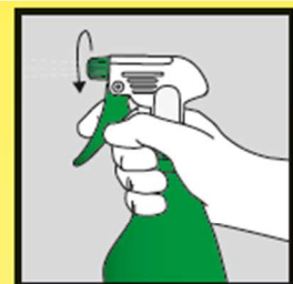
Sprühdüse aufdrehen und Pflanze besprühen.