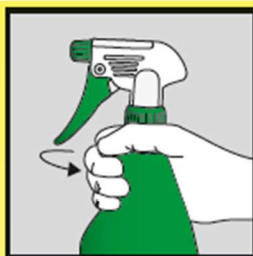
Verschluss gut zudrehen.