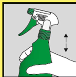
Flasche kräftig schütteln.